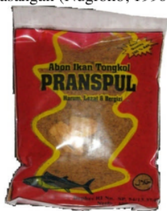
a. Kemasan baru