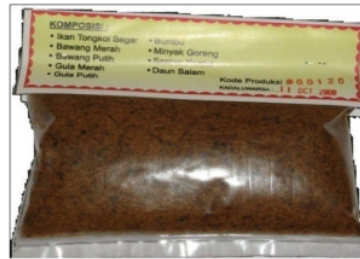
b. Kemasan Lama