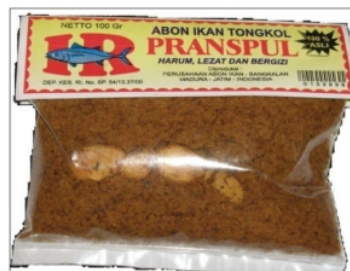
b. Kemasan Lama