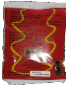
a. Kemasan baru